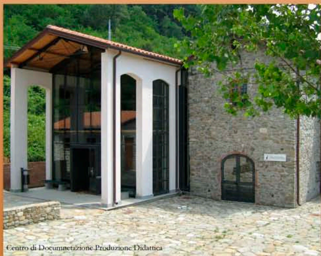
Centro di Documentazione e Produzione Didattica

Il Centro di Documentazione e Produzione Didattica di Filattiera, con le sue diverse sezioni (espositiva, didattica e di restauro), si configura come polo volto alla tutela e alla divulgazione scientifica del patrimonio archeologico, storico ed artistico del territorio, e si rivolge quindi non solo ad una utenza di tipo scolastico, ma ad una utenza più vasta che comprende anche studiosi, turisti ed in genere tutti coloro che vogliono conoscere le principali vicende storiche locali e della Lunigiana, ed i possibili itinerari ad esse collegati.